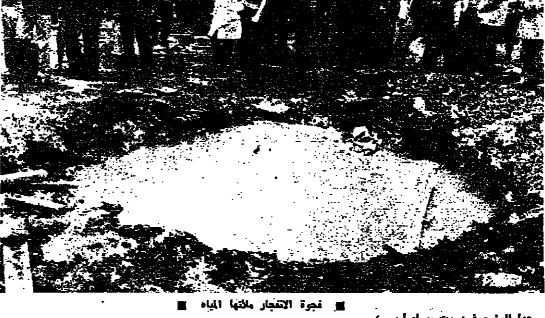
فجوة التفجير ملأها المياه